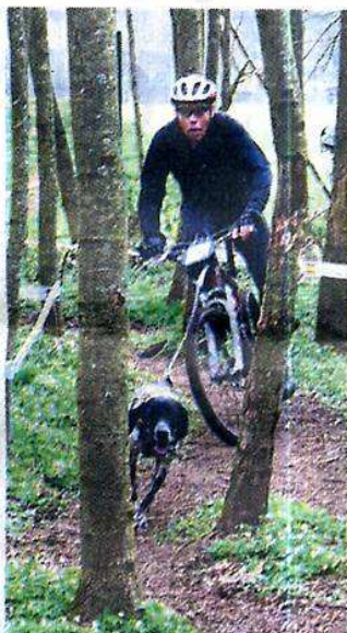
Manœuvre délicate entre les arbres.

Le deuxième canicross d'Oberhaslach a attiré 150 participants hier. Les alentours de la salle des fêtes sont donc devenus le terrain de jeu des chiens et de leurs maîtres qui devaient effectuer ensemble un parcours de cross et de VTT. (Lire en pages Région)