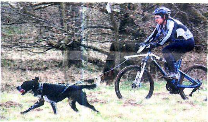
Le plaisir de concourir avec son chien.