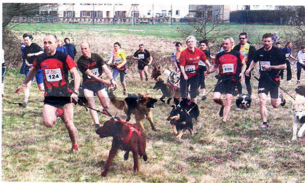
Le départ est donné pour sept kilomètres de course.