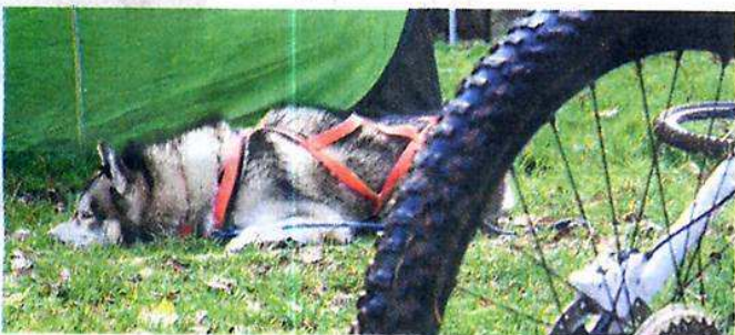
Un repos bien mérité.